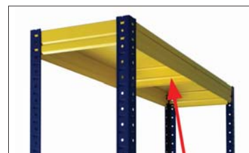
Ребро жесткости полки (SB)