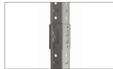
Соединитель стойки (SB/KD)