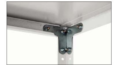
Усилитель стойки (MS)