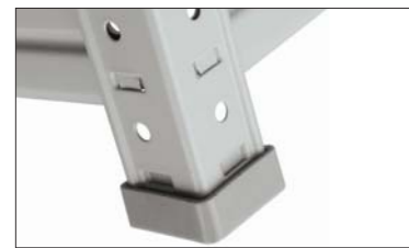
Пластиковый подпятник (SB)