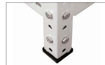
Пластиковый подпятник (MS)