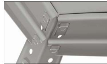
Безболтовое крепление (SB)