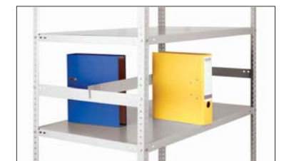
Продольный разделитель MSP (MS)