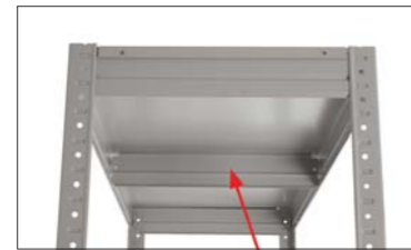
Ребро жесткости (SB)