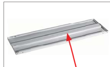
Ребро жесткости полки (MS)