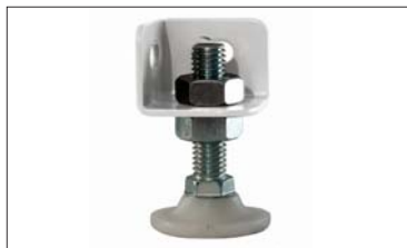
Регулируемый подпятник (MS)