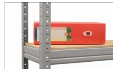
Фанерная полка (SB)