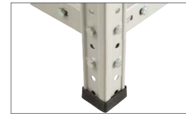
Подпятник (Strong MS)