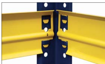
Безболтовое крепление (SB)