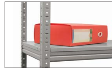
Металлическая полка (SB)