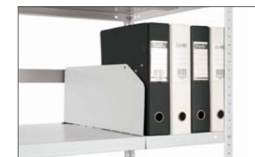
Разделитель полки и планка ограничительная (MS)