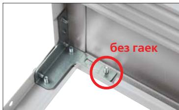
Усилитель стойки (комплект MS)