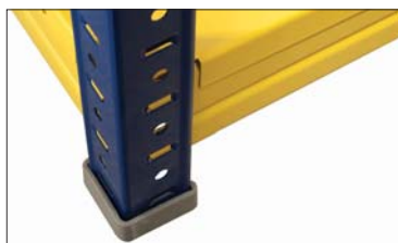
Пластиковый подпятник (SB)